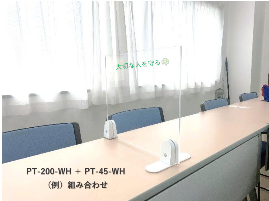
PT-200-WH + PT-45-WH (例) 組み合わせ