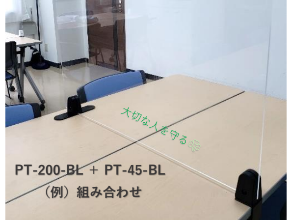
PT-200-BL + PT-45-BL (例) 組み合わせ